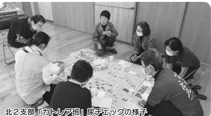
北2支部「カトリック班」尿チエックの様子

「検査」「体重、体脂肪などの測定」の3つの健康チェックを基本的に行います。他にも、希望する班には医療生協の職員が訪問し「血管年齢チェック」「握力・足指力チェック」「骨密度チェック」なども行っています。つまり、身近な場所で定期的に、気軽に健康チェックが出来る場になります。出来れば、集まった人と楽しくお話をすることで、健康でいきいきとした毎日を過ごすことができ、認知症予防などに繋がります。