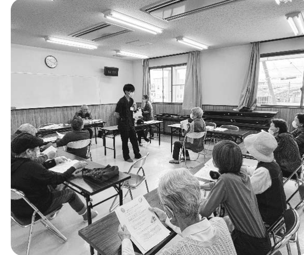
東部支部「高洲コミュセン班」医師との交流

「班」ができれば、「班会」を開くことができます。班会は「血圧チェック」が中心です。班会は「血圧チェック」が中心です。班会は「血圧チェック」が中心です。