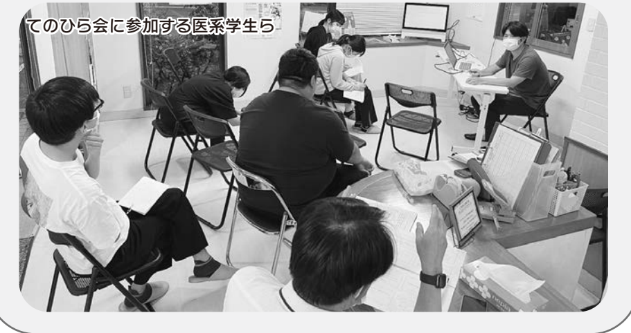
てのひら会に参加する医系学生ら