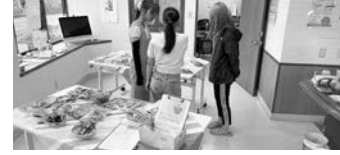
食品を選ぶ医系学生

●ご寄付いただきたい食品等 ◎2~3kgで小分けされたお米 ◎バックご飯 ◎パスタなどの乾麺 ◎パスタソース ◎インスタント食品 ◎お菓子 ◎生理用品 ◎ティッシュ ◎宮崎市指定のゴミ袋 支援していただく食品は最寄りのクリニックでも受け付けています。詳細は中原までご相談ください。