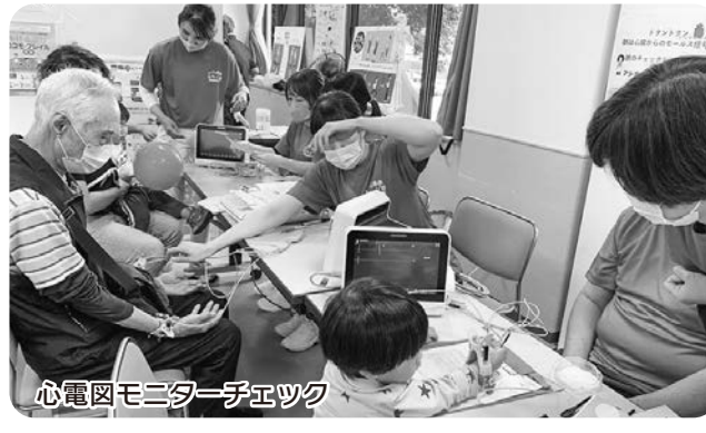
心電図モニターチェック

・今年の健康まつりのステージでは、エイサーや地域の子どもたちによるダンス、ひよっこなど様々な演目が披露されます。お楽しみに! ・当日の店は、焼きそばや豚汁、赤飯など色々なものが出される予定です。 ・宮崎大学みやざき健康キャラバン隊がやってきます。手首で図れる心電図体験! かくれ心臓細胞を見つけて脳卒中を予防しましょう。※料金は無料です。 ※駐車場には限りがあるので、できるだけ公共交通機関でのご来場をお待ちしています。