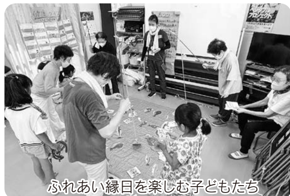
ふれあい縁日を楽しむ子どもたち

8月の夏休みに合わせて、宮崎生協病院近くの地域の8カ所の居場所(宮崎市の市民活動補助金活用)のうち4カ所で「ふれあい縁日」を実施しました。この取り組みは普段の活動で行っている高齢者の居場所づくり・フレイル予防だけでなく、子育て世代とのつながりや、子どもが医療に触れて学ぶ機会をつくる目的で昨年度から行っています。