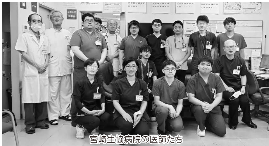
宮崎生協病院の医師たち