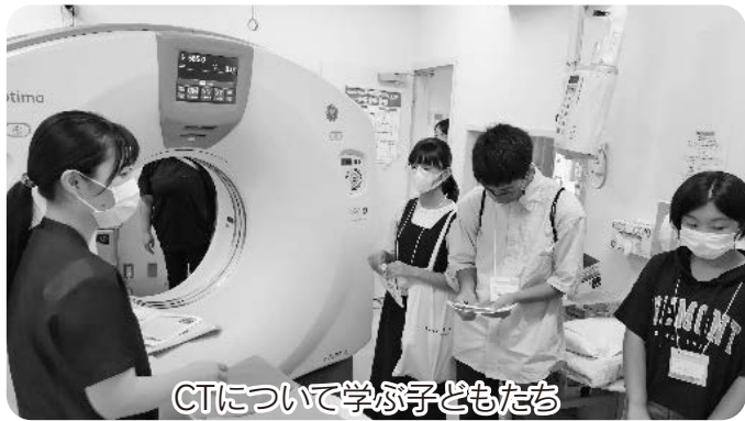
CTについて学ぶ子どもたち

参加した子どもたちからは「病院にはたくさん検査する部屋があり、大きい機械や小さい機械があつてすごいと思った」「早食いをしないでお茶を飲みすぎないようにします」「煙草を吸ったら止められないことが分かり、吸いたくないなあと思っただ」「放射線技師を目指したいと思っただ」などの感想を聞くことができました。この取り組みは来年も開催予定となっております。興味のあるお子さんやお孫さんがあればぜひご参加ください。