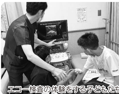
エコー検査の体験をする子どもたち

7月27日(土)、宮崎医療生協本部で小学生を対象とした「めだかの学校」、中学生を対象とした「子どもの保健学校」を開催されました。この日は小中学生併せて14名、保護者が7名参加し、学習に取り組みました。この日の内容は、小児科医師による講義「からだのしくみ」、病院の検査室と放射線科の見学、たばこの害を説明するための実験となっており、最後まで参加した子どもたちには手作りの修了証が手渡されました。