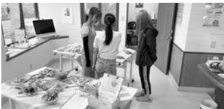
食品を選ぶ医系学生

支援していただく食品は最寄りのクリニックでも受け付けています。詳細は中原までご相談ください。